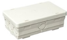
Duurzame lasdozen 3611 S-serie