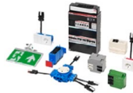
Stekerbaar en slimmer installeren