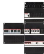
SEM- energiemanagement- systeem