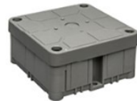
Duurzame kabeldozen 3640 S-serie