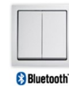
Draadloos schakelen en dimmen