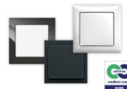
Cradle-to-cradle- gecertificeerd schakelmateriaal